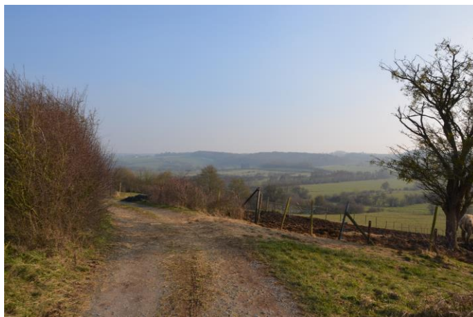
(Commune de Beauraing)