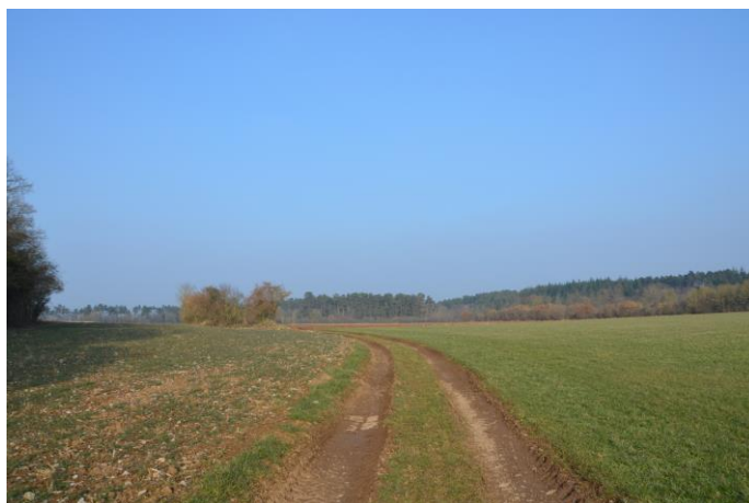
(Commune de Beauraing)